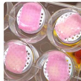
Modèles de peau bio-imprimées Poietis