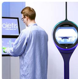
Bio-imprimante industrielle (NGB 17.03)